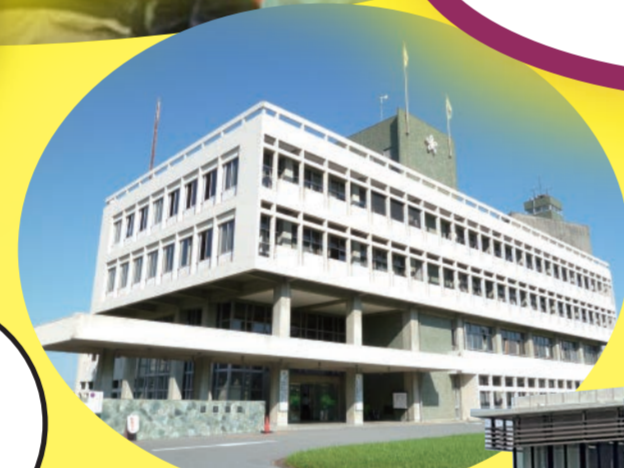
桜井市役所旧本庁舎